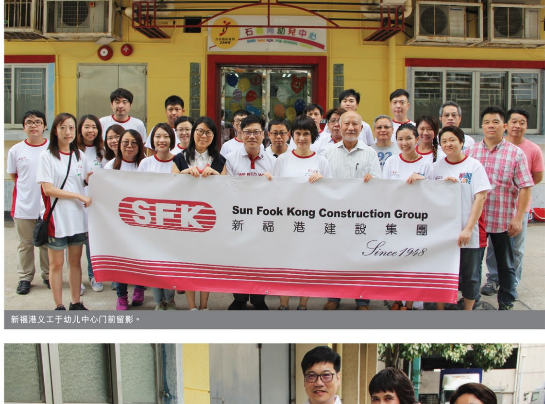
新福港义工于幼儿中心门前留影。

新福港于6月3日举办了一个名为「油」心出发 - 幼儿中心油漆翻新活动，新福港义工队积极参与，透过为社区的幼儿中心重新翻上油漆，令外墙焕然一新，共同渡过了一个有意义的早上。