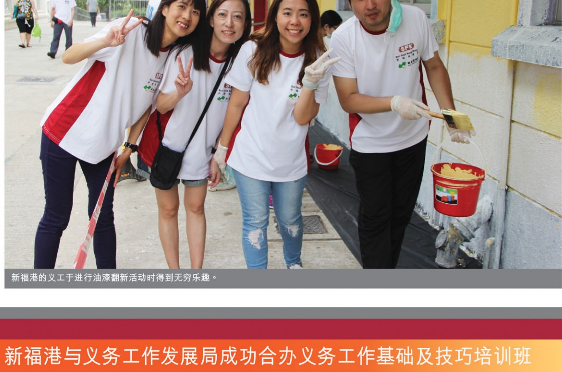
新福港的义工于进行油漆翻新活动时得到无穷乐趣。