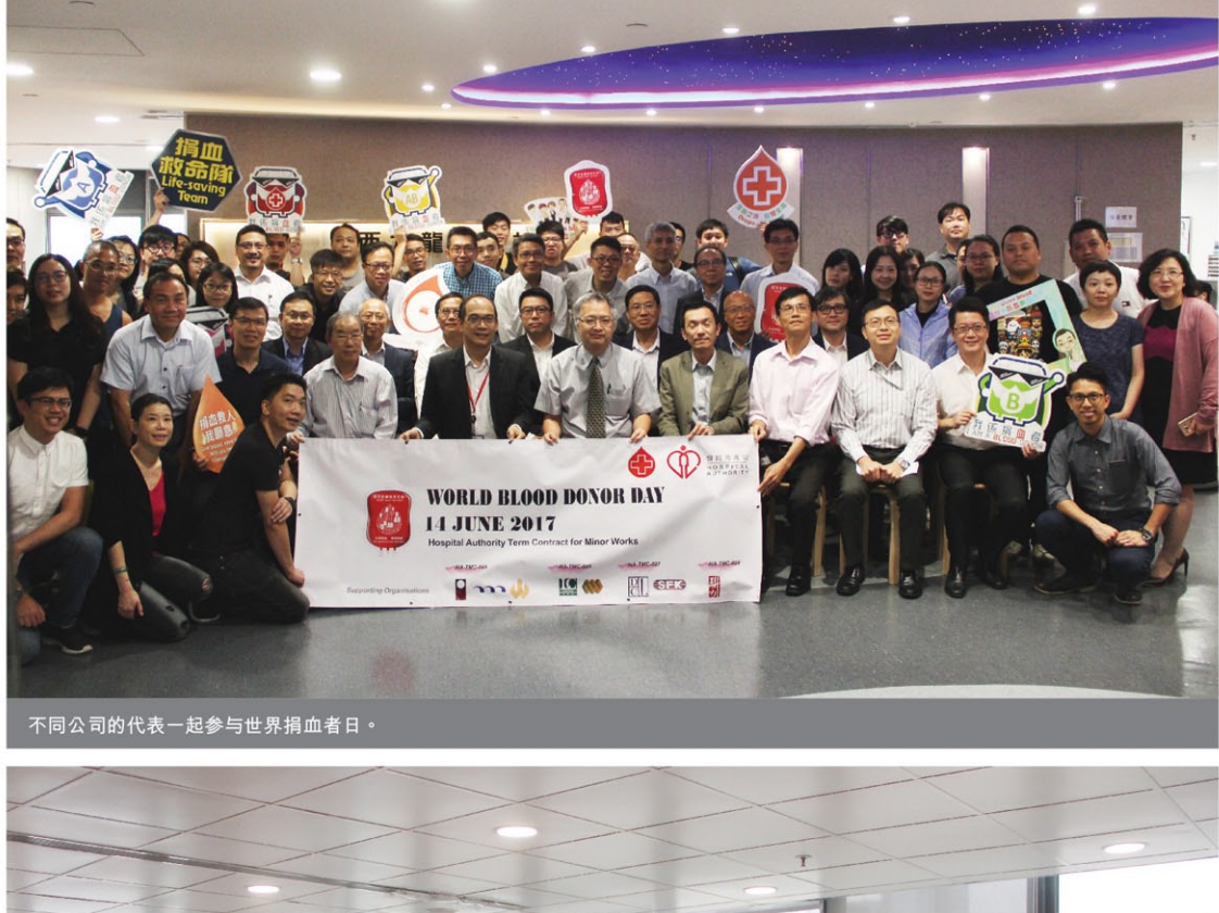
不同公司的代表一起参与世界捐血者日。

一年一度的世界捐血者日于6月14日举行，新福港继续通过鼓励和组织员工参与捐血活动。