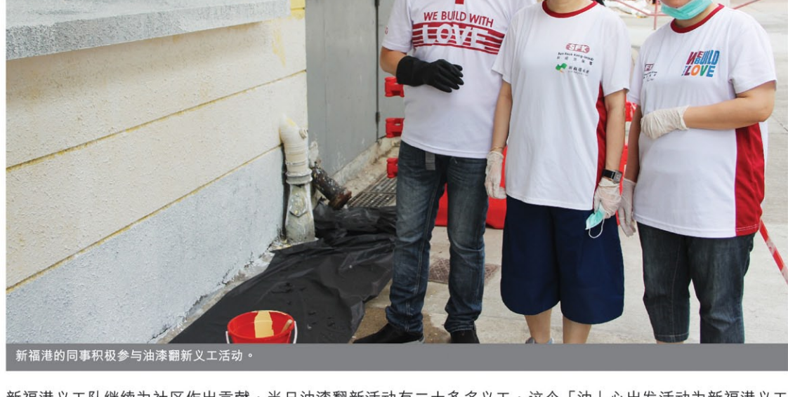
新福港的同事积极参与油漆翻新义工活动。

新福港义工队继续为社区作出贡献，当日油漆翻新活动有二十多名义工，这个「油」心出发活动为新福港义工队队员提供了回馈社会的机会，为幼儿中心描绘了丰富多彩的空间。