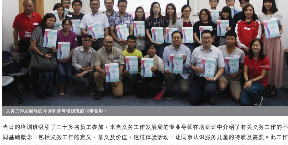
义务工作发展局的导师和参与培训班的同事合影。

新福港于7月19日举办了义务工作基础及技巧培训班，邀请到义务工作发展局提供培训，内容包括服务儿童时的技巧，倡导对社会作出贡献。新福港的义务队并于当天下午参与了一个有意义的演讲和一连串启发性的游戏。